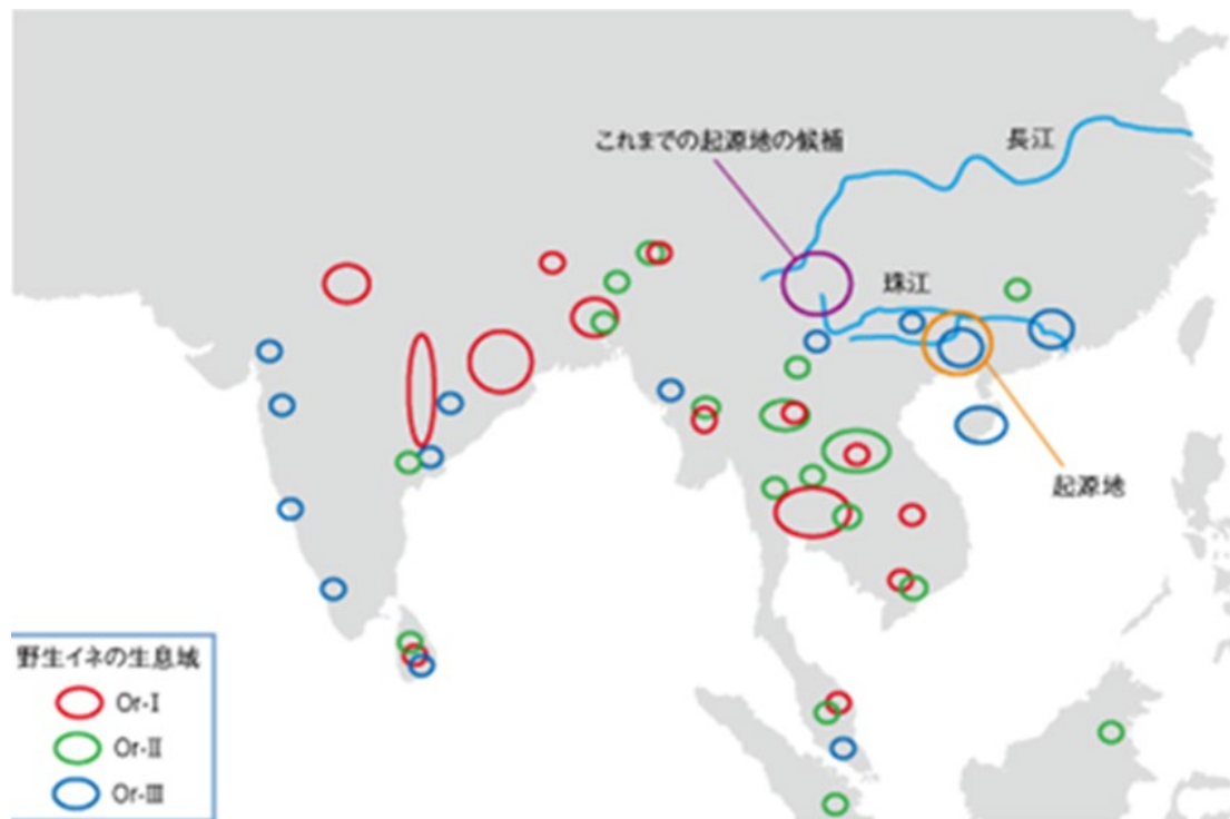
図13-2 野生イネのグループ別の生息域と栽培化の起源地

次に、遺伝的な変異パターンにもとづき、栽培化の過程で強い選択的なスイープ 2 の起こった55箇所のゲノム領域を検出しました。これらの領域には、脱粒性、草型、粒幅など、栽培化にかかわる重要な遺伝子が存在していました。これら55の栽培化遺伝子に焦点を当てて SNP 3 による選択的スイープの起こったゲノム領域だけでなく全ゲノムの精密な解析から、栽培イネ O. sativa のうちジャポニカは、野生イネ O. rufipogon の Or-III グループ（多年生）を起源とし、一方インディカは Or-I グループ（一年生）を起源にもつことが分かりました（図13-1）。図13-1に示された円のサイズは、各グループの遺伝的な変異の大きさを表し、グループの間の数値は、遺伝的な分化（類縁関係）の程度を示しています。