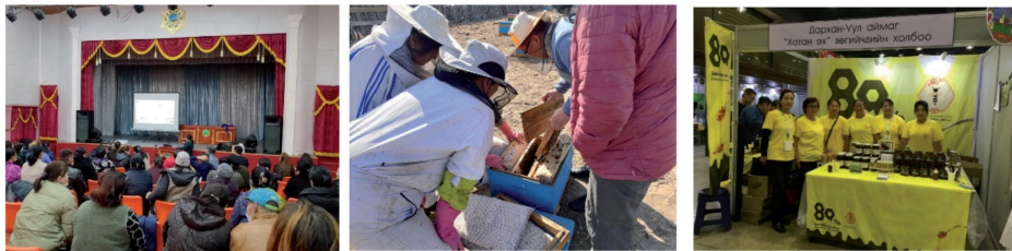
Зураг: Холбооноос зохион байгуулсан семинар (зүүн гар тал), зөгийчид зориулсан технологийн сургалт (дунд), холбоотой хамтран оролцсон үзэсгэн худалдаа (баруун гар тал)