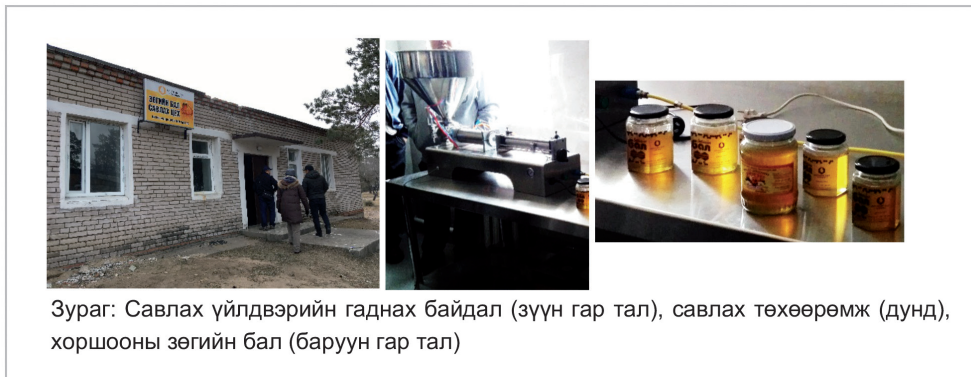
Зураг: Савлах үйлдвэрийн гаднах байдал (зүүн гар тал), савлах төхөөрөмж (дунд), хоршооны зөгийн бал (баруун гар тал)