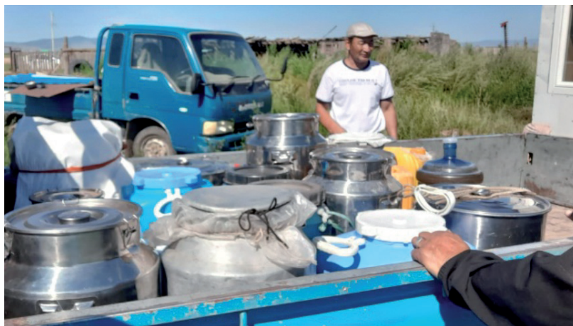
Зөгийчид зөгийн балаа нэгтгэж үйлдвэрт нийлүүлэхээр бэлтгэж байгаа нь.

Зөгийн балны үйлдвэрт борлуулахад тодорхой хэмжээний буюу түүнээс дээш зөгийн бал нийлүүлэх шаардлагатай байдаг тул бүлгээрээ нэгтгэж цуглуулдаг. Жижиг аж ахуй эрхлэгчид үйлдвэрт борлуулахыг хүссэн ч борлуулж чаддаггүй байсан бол бүлгээрээ нэгдсэнээр борлуулж чаддаг болсон байна. Мөн үйлдвэр нь зөгийн балын чанарын тухайд MNS стандартыг дагаж мөрдөх, балт ургамал нь тодорхой байхыг шаарддаг бөгөөд бүлгийн ахлагч бүлгээсээ чанарын анхан шатны үзлэг хийгээд үйлдвэрт нийлүүлдэг нь үйлдвэртэй харилцан итгэлтэй ажиллах харилцааг бий болгож байна.